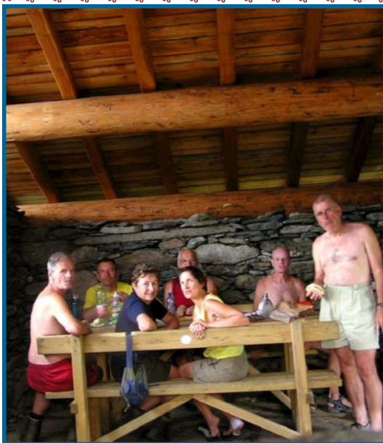
nuova baita Fontanini