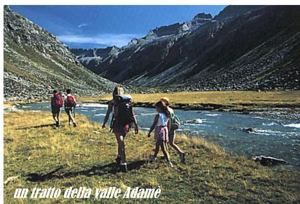
un tratto della valle Adamè