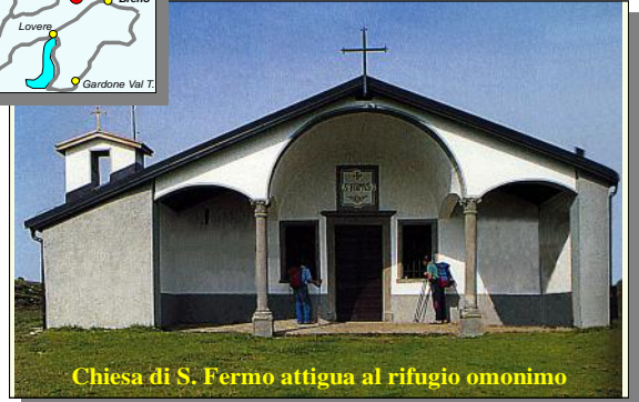
Chiesa di S. Fermo attigua al rifugio omonimo