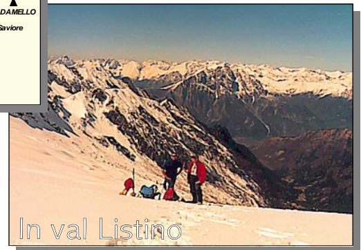
In val Listino