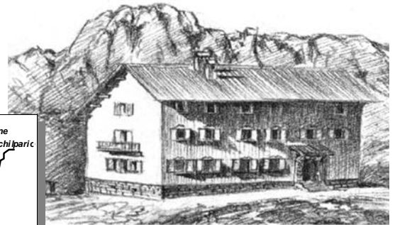
RIF. LAGHI GEMELLI